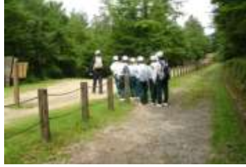
①山際の砂利道を下る