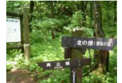
⑪女三瓶コース トイレ