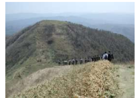
⑥子三瓶山頂から孫三瓶を望む