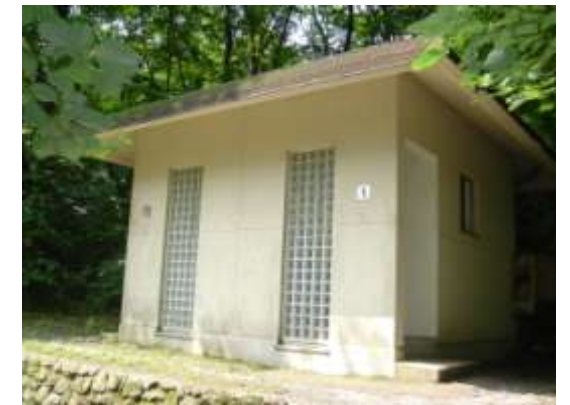
⑧室の内・女三瓶・東の原分岐