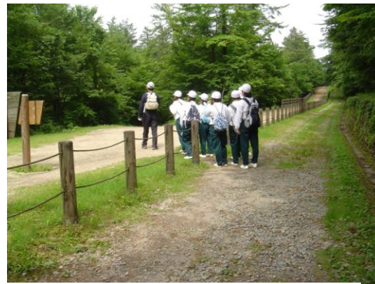
②中国自然歩道入口