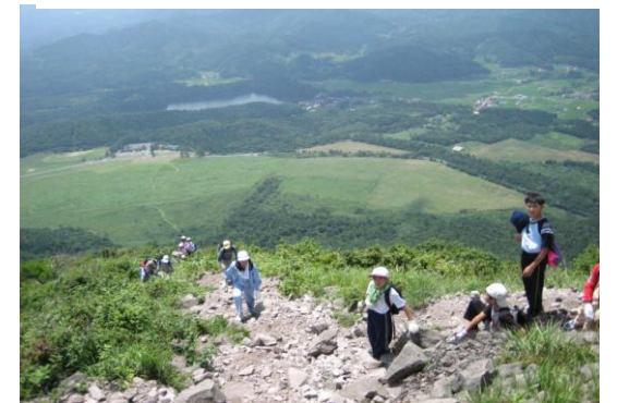
④西の原 トイレ・レストハウス