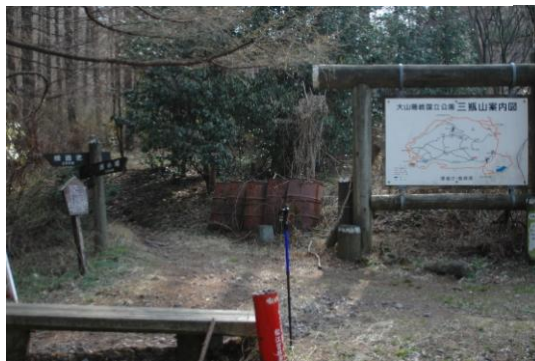
西の原登山口・道標