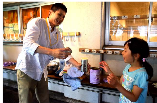
ペットボトルを使ったアイスクリーム作り