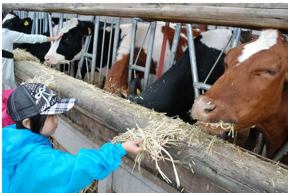
しっかり牛と触れ合ったよ!