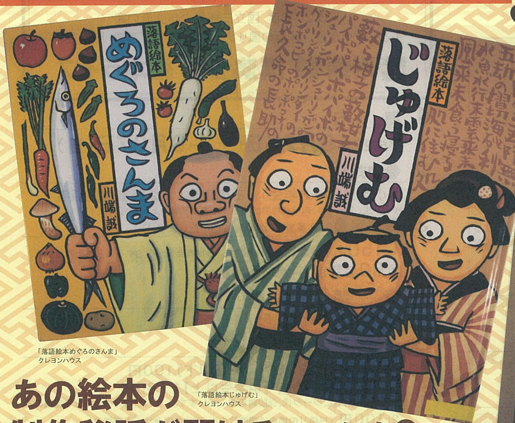
「落語絵本めぐるのさんま」 クレヨンハウス