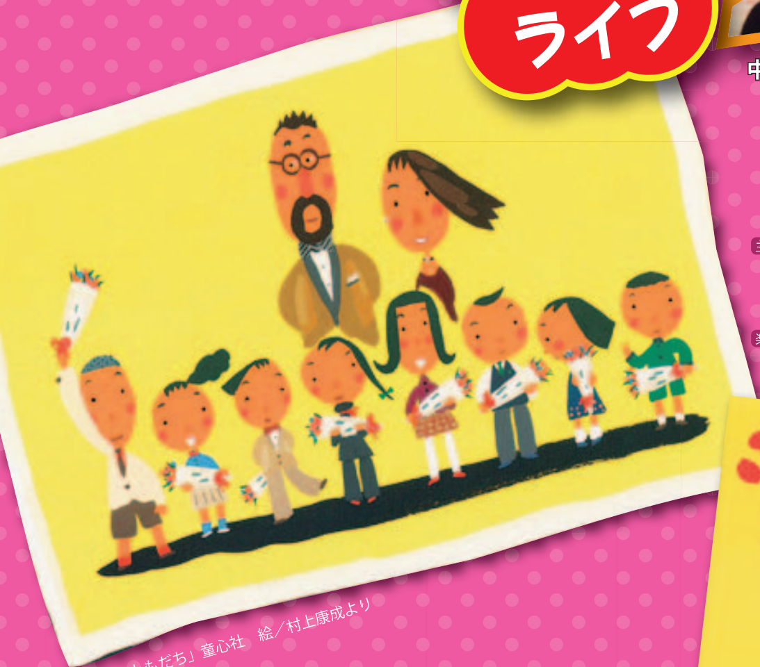
「みんなともだち」童心社 絵/村上康成より