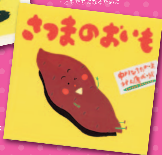
「さつまのおいも」童心社 絵:村上康成