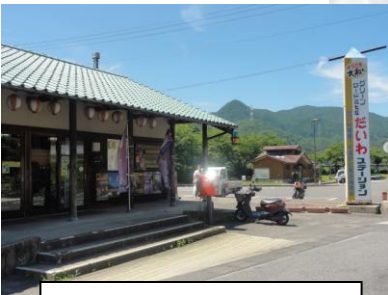
⑨グリーンロード大和