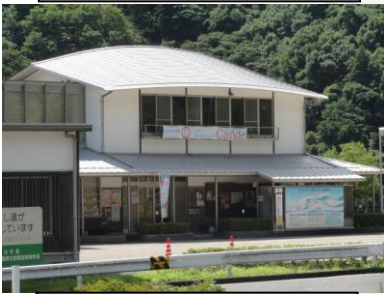
⑦カヌー公園さくぎ