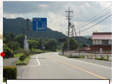
②高北広域農道へ右折