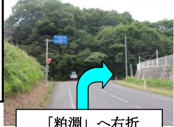
「粕淵」 ~ 右折