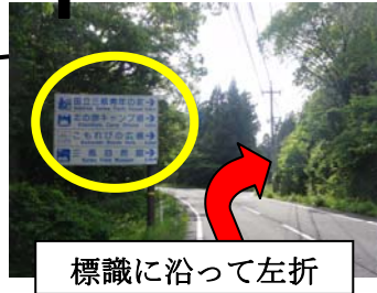
標識に沿って左折