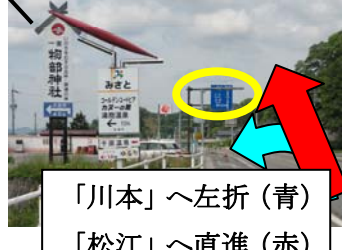
「川本」 ~ 左折 (青) 「松江」 ~ 直進 (赤)