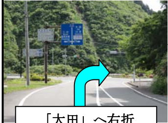
「大田」 ~ 右折