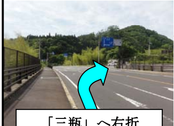
「三瓶」 ~ 右折