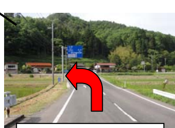
「三瓶山」 ~ 左折