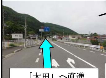
「大田」 ~ 直進