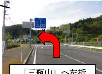
「三瓶山」 ~ 左折