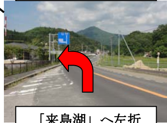
「来島湖」 ~ 左折