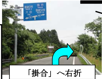
「掛合」 ~ 右折