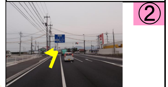
② 「大島」交差点を大田方面に左折