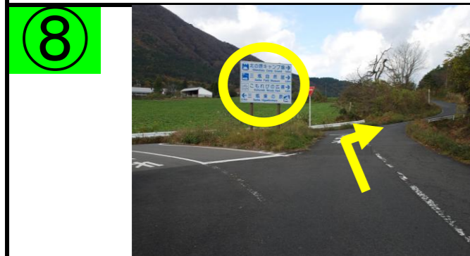
⑧ 標識に沿って右折