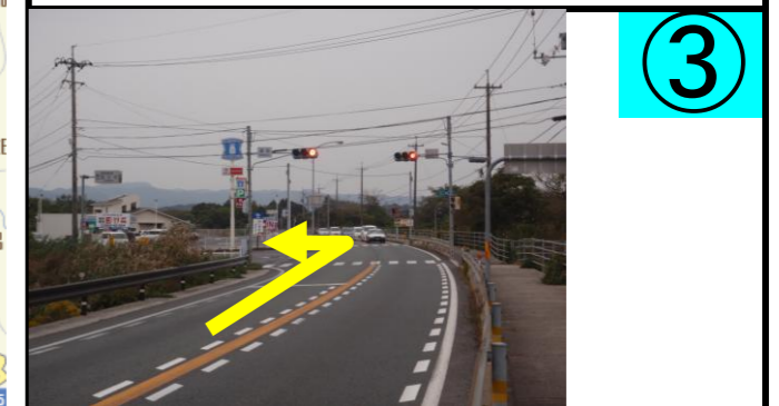
③ 「差海」交差点を左折