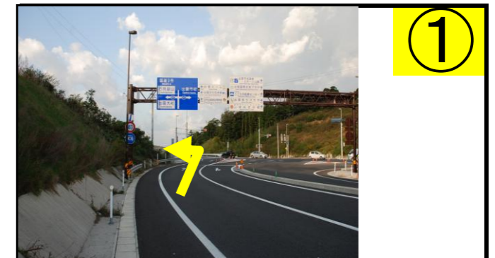
① 「国道9号」方面に左折