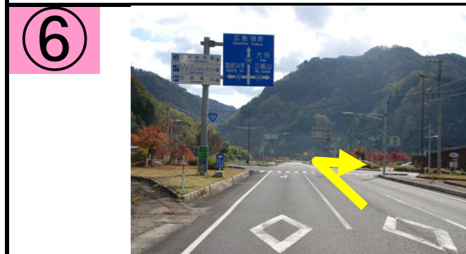
⑥ 「三瓶山」方面に右折