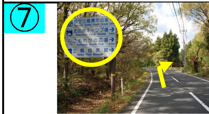
⑦ 標識に沿って右折