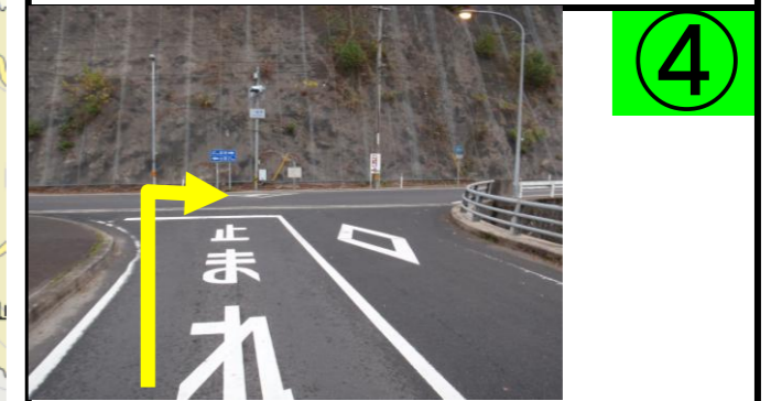
④ 「八幡原」交差点を右折