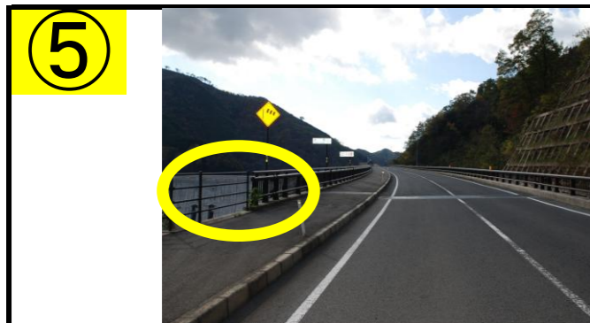
⑤ 「志津見ダム」が左手に見える