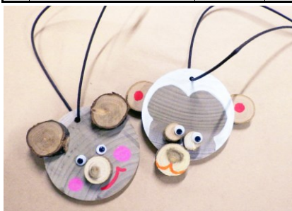
木工キーホルダー