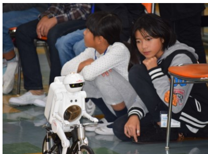
工場見学(出雲村田製作所イワミ工場)