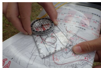
オリエンテーリング