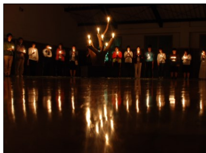
キャンドルのつどい