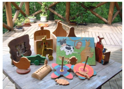
木工体験(三瓶こもれびの広場 木工館)