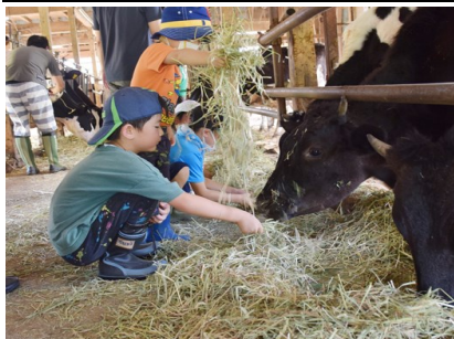
牧場見学(福間牧場)