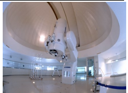
博物館学習(島根県立三瓶自然館サヒメル)