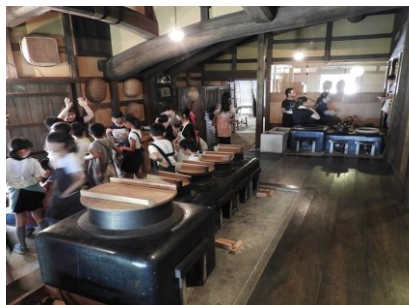
石見銀山学習(熊谷家住宅)