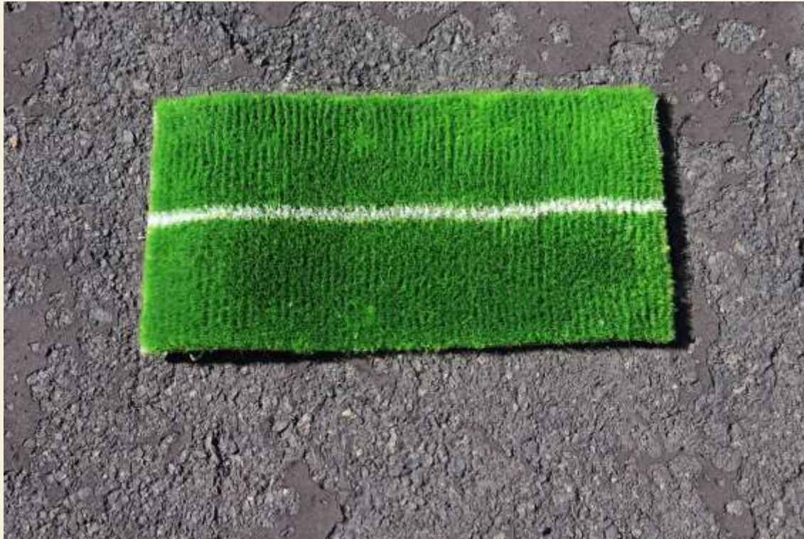
アスファルト用マット