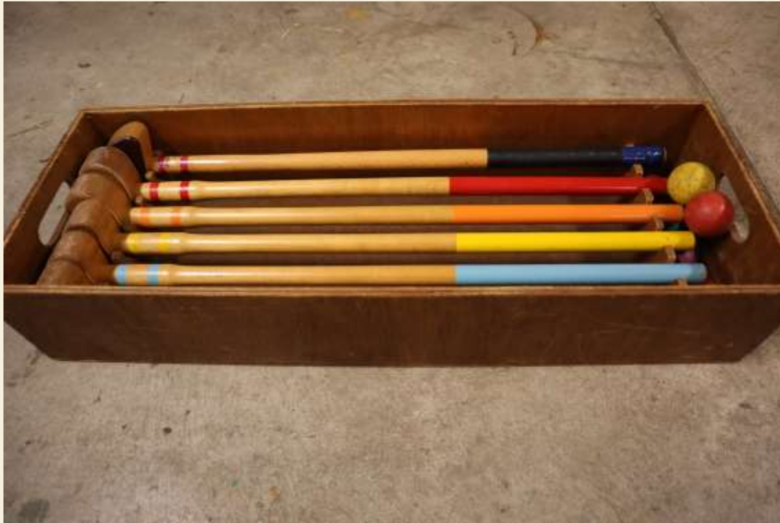
スティック・ボール(1セット6つずつ)