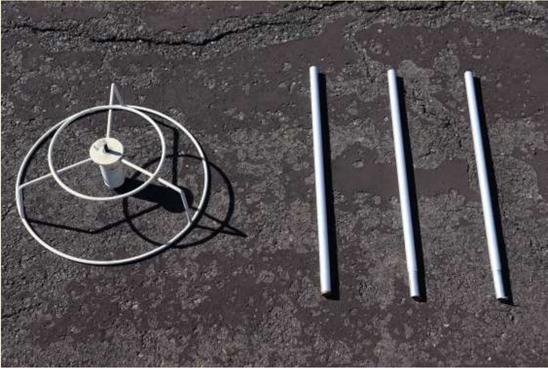
ホールポスト台・ポール (ポールは3本で1組)