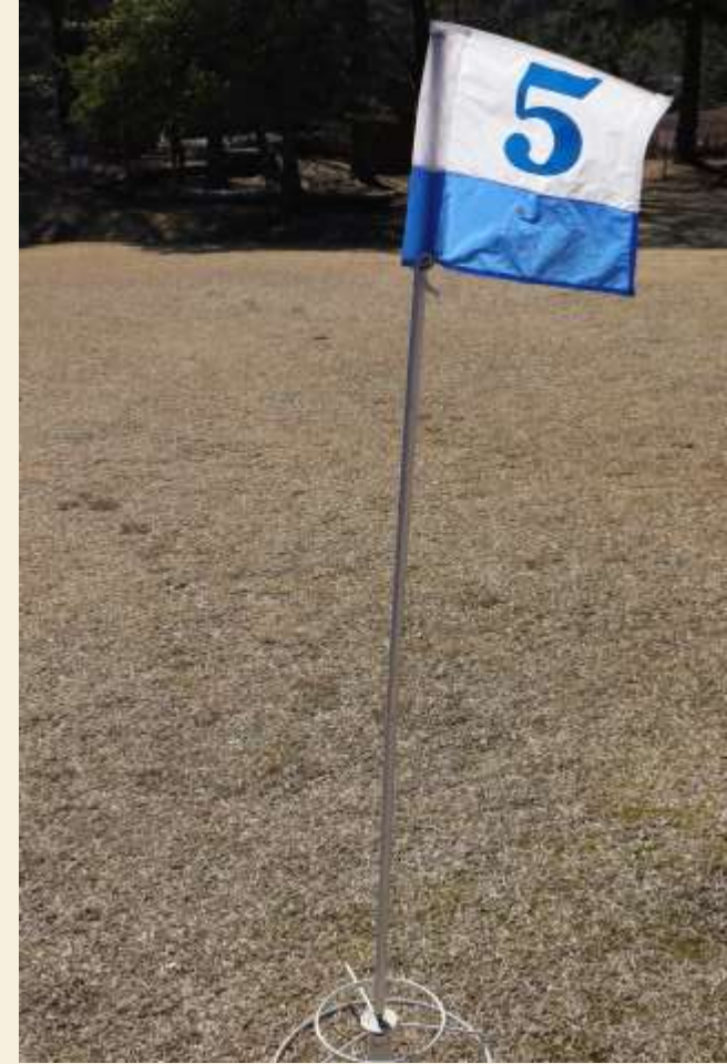
台とポールを組み立てる。