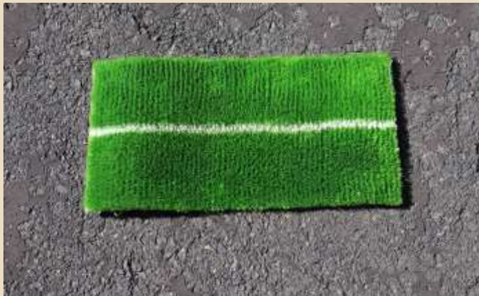
アスファルト用マット