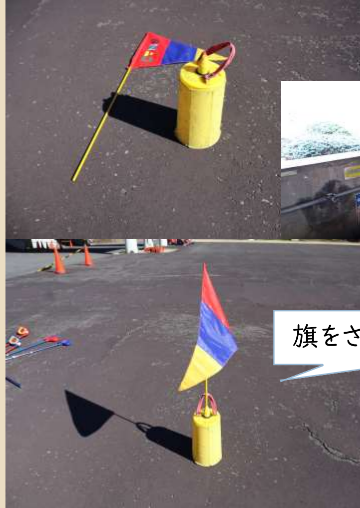
スナッグフラッグ