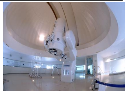
博物館学習（島根県立三瓶自然館サヒメル）