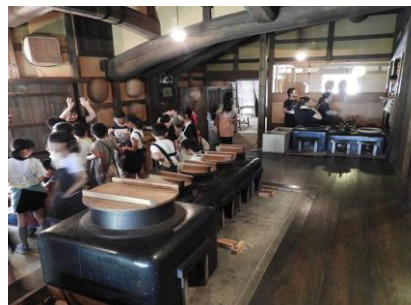
石見銀山学習（熊谷家住宅）