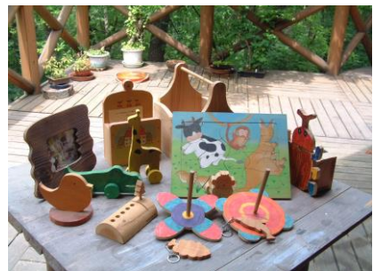
木工体験（三瓶こもれびの広場 木工館）