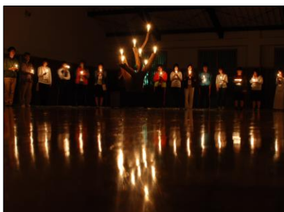
キャンドルのつどい