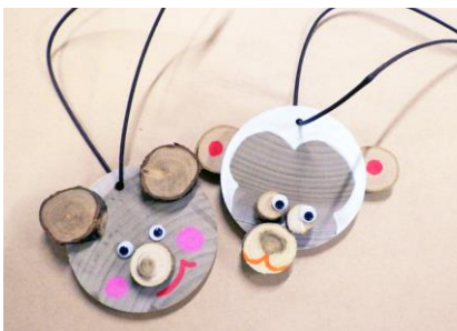
木工キーホルダー