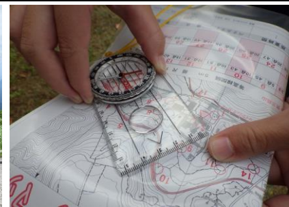
オリエンテーリング