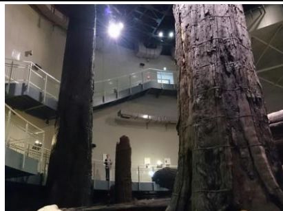
歴史・環境学習（さんべ縄文の森ミュージアム）