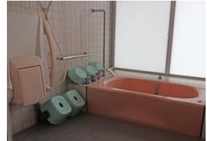
身体障害者用の浴室（ケアルーム）