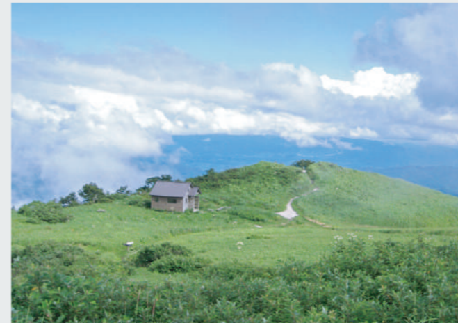
三瓶山登山・中国自然歩道ハイキング