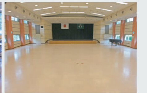
講堂(400人)ステージ付・ピアノ常設・放送設備