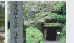
世界遺産 石見銀山