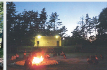
第1営火場(400人)、第2営火場(200人)ファイヤーストーム(焚き火)ができます。