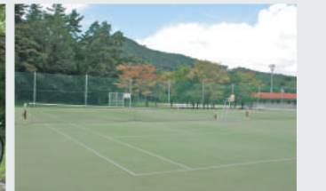
テニス(オムニコート4面)