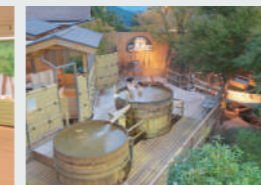
三瓶温泉 国民宿舎さんべ荘