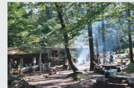
BBQや野外炊飯、ピザやローストチキン作りなどさまざまなアウトドア料理ができます。

手ぶらで参加可能。野外炊飯・BBQ・アウトドアクッキングや、ファイヤーストーム(焚き火)などで必要な食材や器材をご提供します。