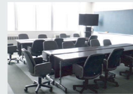
研修室(10室): プロジェクター・スクリーン無料貸出、冷暖房完備