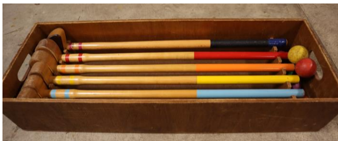
スティック・ボール（1セット6つ）