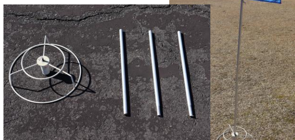
ホールポスト、支柱、フラッグ