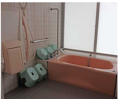
身体障害者用の浴室（引率者控室）