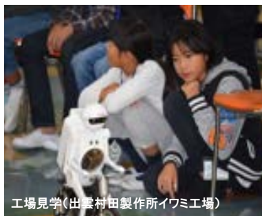
工場見学(出雲村田製作所イワミ工場)