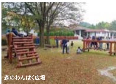
森のわんぱく広場