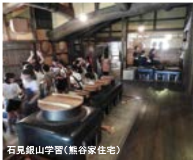
石見銀山学習(熊谷家住宅)