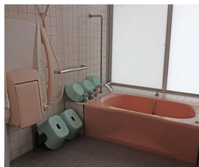
身体障害者用の浴室（引率者控室）