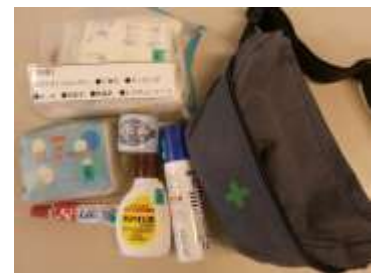
携帯用救急バック