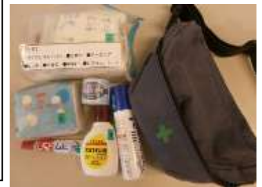
携帯用救急バック