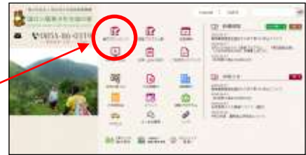
日帰り利用申込書