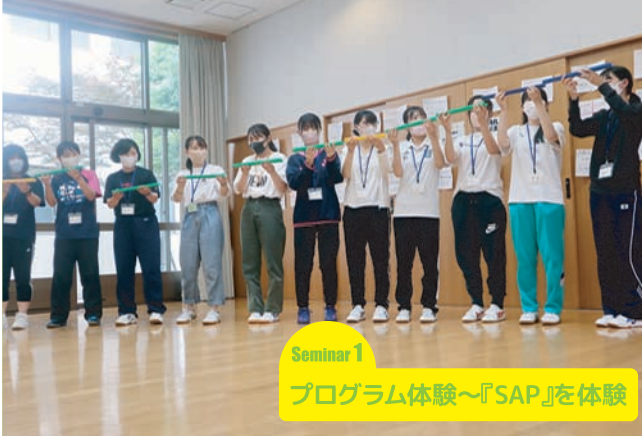
Seminar 1 プログラム体験～『SAP』を体験