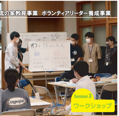
Seminar 3 ワークショップ