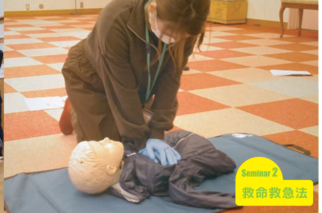
Seminar 2 救命救急法