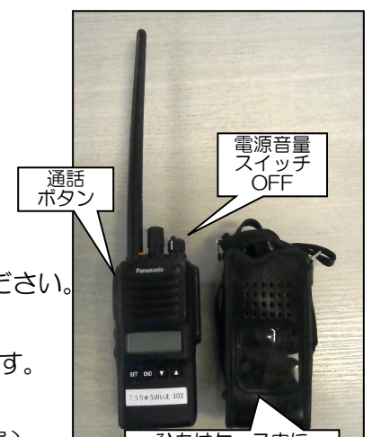
ひもはケース内に