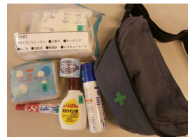
携帯用救急バック