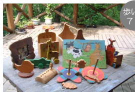
三瓶自然館サヒメル TEL (0854) 86-0500