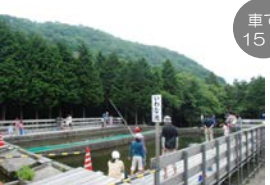
三瓶小豆原埋没林公園 TEL (0854) 86-9500